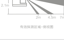
有效探测区域-侧视图